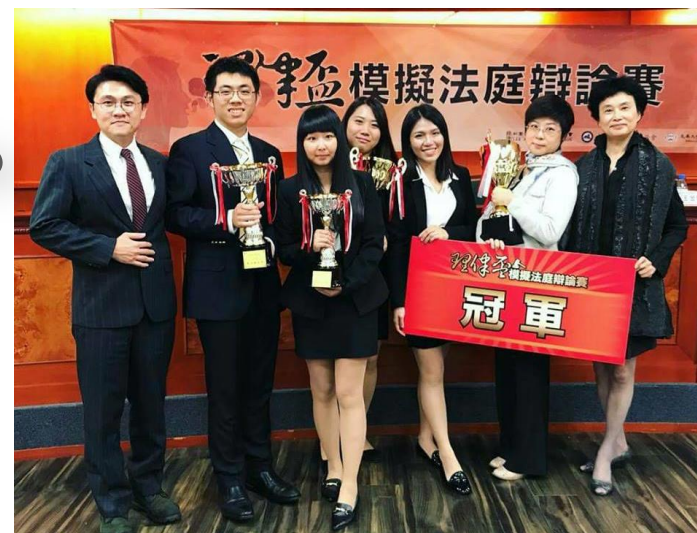
2017 理律盃 冠軍