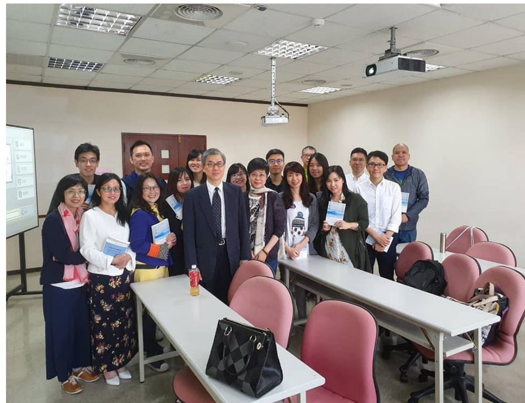
(金融監理各論與學生合影 攝於2019/04/20)